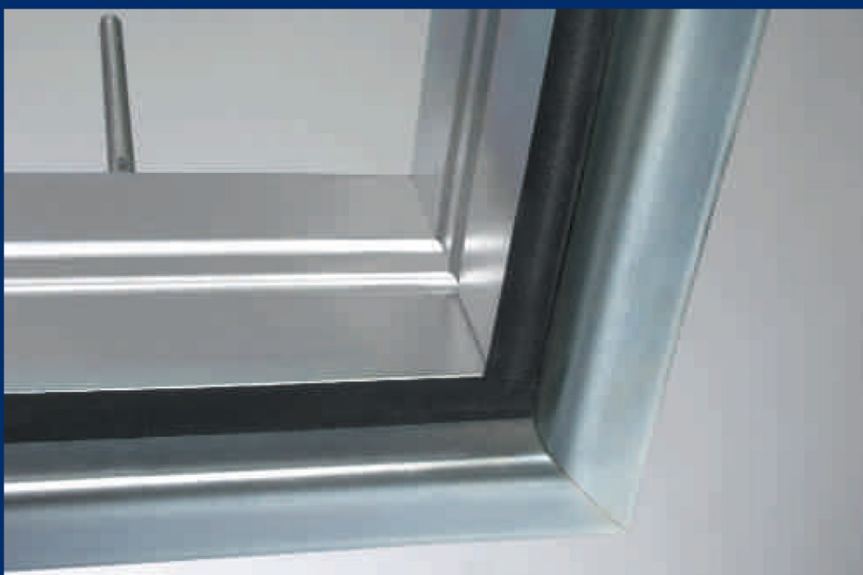
Guarnizione di chiusura tra cassonetto e pannello. Rubber packing fitted between Box-Frame and panel. Protección de cierre entre la caja y el panel.